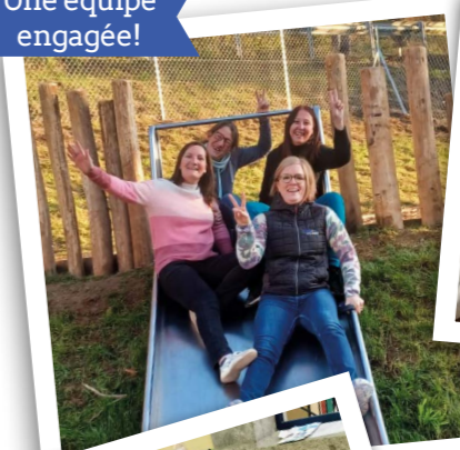
Une équipe engagée!

Dans la continuité de nos efforts anti-gaspillage, il a été proposé le passage aux serviettes tissus, merci aux parents qui ont tous validé la proposition et aux enfants qui rapidement ont pris leurs marques et de nouvelles habitudes.