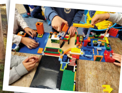
Recherche légos désespérément, merci pour vos dons!