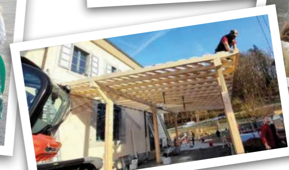
Travaux du préau