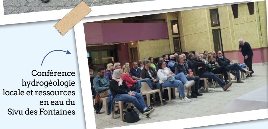
Conférence hydrogéologie locale et ressources en eau du Sivu des Fontaines