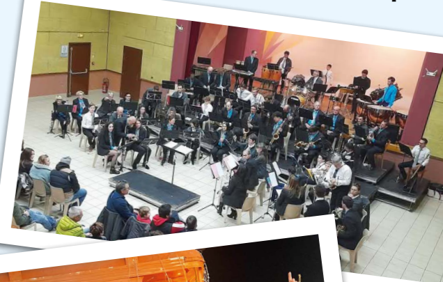
Concert de Noël de l'harmonie Municipale Châtillon-sur-Cluses-St-Sigismond avec l'harmonie de Mieussy