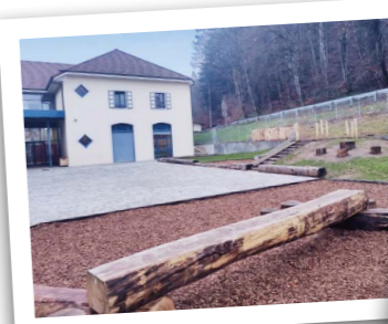
Soyons rassurés les travaux sont surveillés de très près !