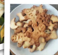
Atelier biscuits de Noël