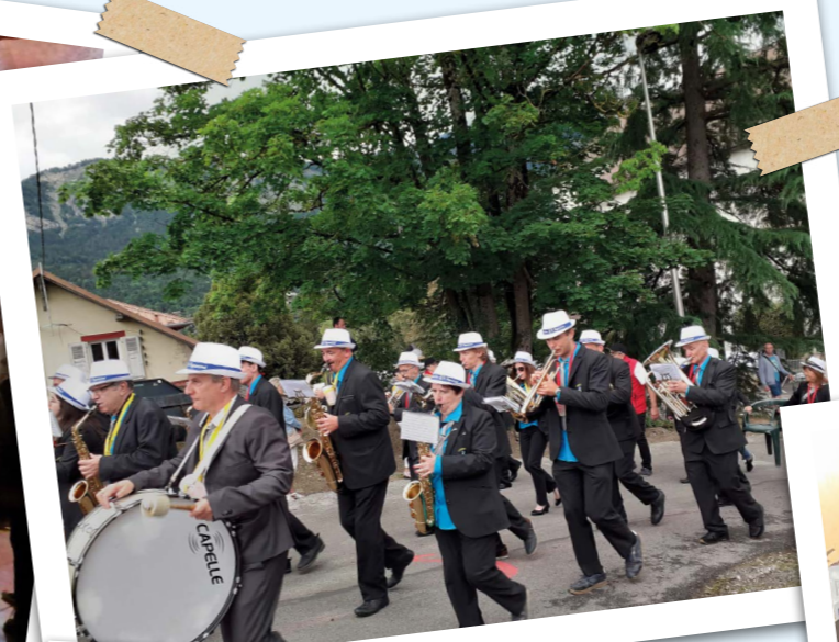
Festival des Musiques du Faucigny Bonneville Harmonie