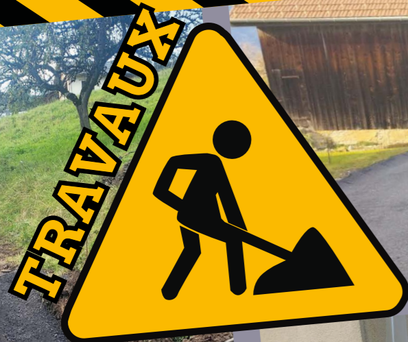
réfection enrobé route de Balmotte