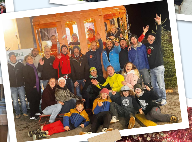
Bénévoles de La Ripaille Cassandrine après un marché de Noël réussi !